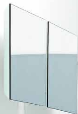
文 & 编辑 /Alice

精致的家居生活能让人时刻感受到美。承担送走疲倦迎来轻松重任的卫浴间，也需要时尚起来，配合整体的家居氛围。想要打造一个时尚的卫浴间，让洗浴拥有更好的心情，并非一定要有太大的空间才可操作。只要有阳光，更换一些常用的物品，卫浴间就能增色不少。